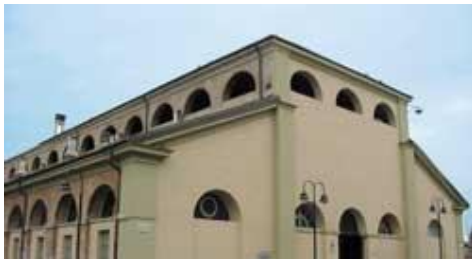
Die Fassade des Arsenal für den Frieden.