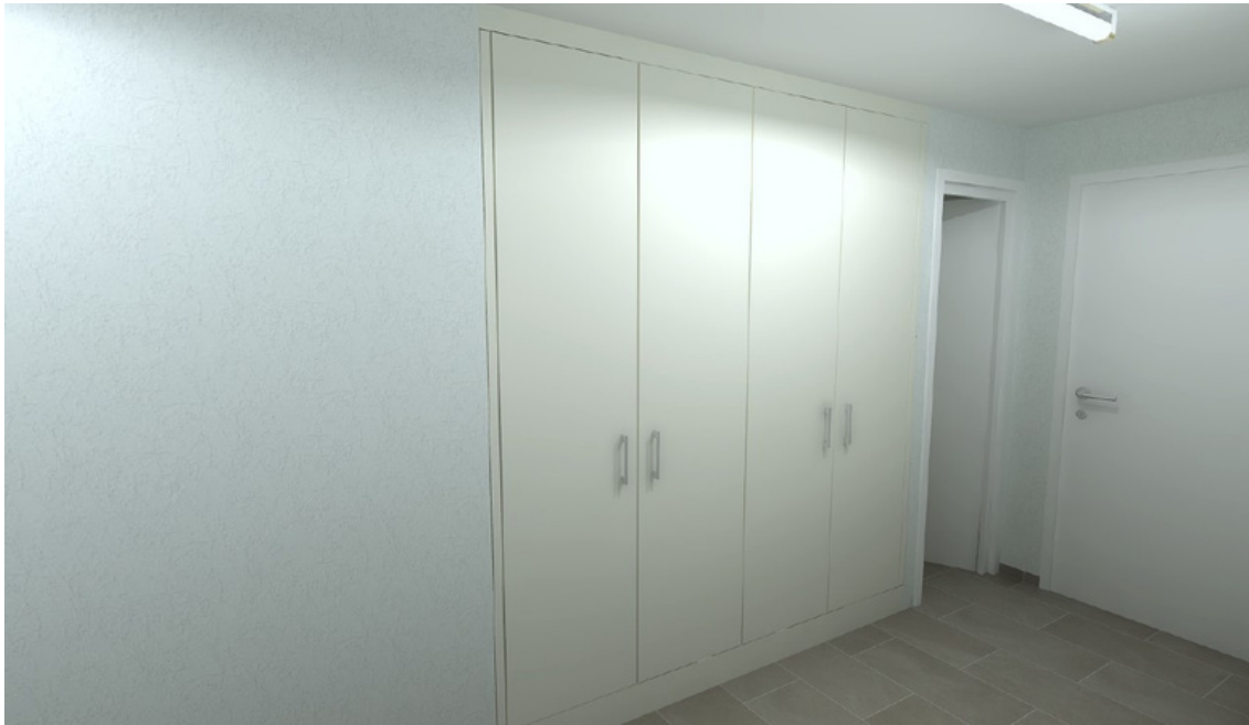
Die neuen Wandschränke im Korridor mit Eingang zur Küche.