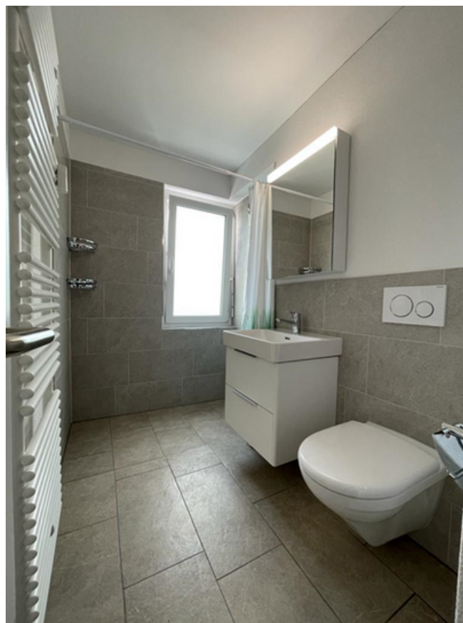
Bild des neuen Badezimmers. Auf dem Bild fehlt noch die Duschtrennwand.